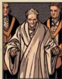
L'initiation de Voltaire